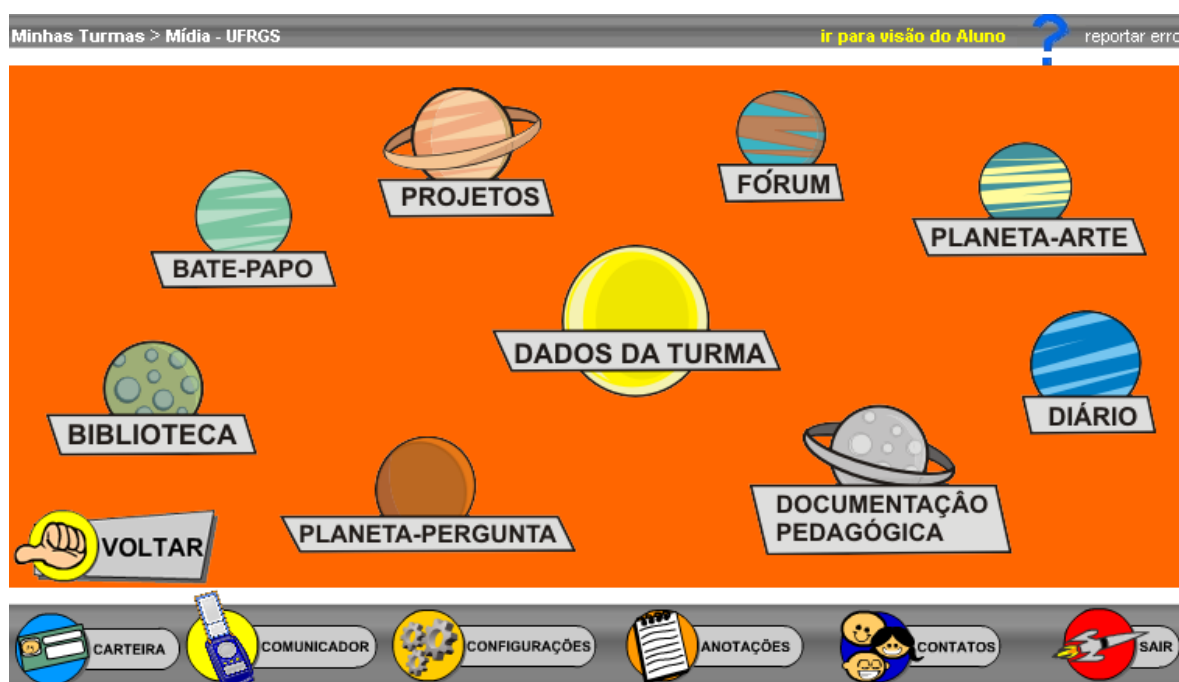
Tela dos planetas: acesso às funcionalidades específicas da turma

A perspectiva topológica é baseada na localização em que você encontra os links para acesso às funcionalidades no ambiente. Assim, as funcionalidades são organizadas na área de trabalho e barra de menu. Independente do link em que você clicar, as informações ficam disponíveis na área de trabalho do ambiente (mesma tela) ou em uma nova janela. Na barra de menu, você encontra as funcionalidades gerais. Na tela inicial da turma, visualiza-se as funcionalidades específicas (planetas).