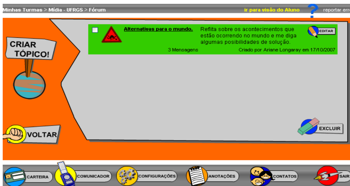
Tela Fórum: visualização dos tópicos

Aluno - acessa a lista de tópicos da turma. Envia e responde mensagens, sem a possibilidade de excluí-las ou editá-las. O aluno também poderá criar e editar tópicos, se o professor habilitar esse item em Dados da Turma .