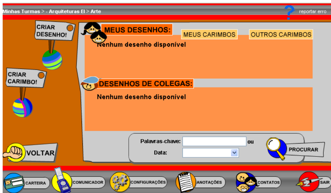
Tela do Planeta Arte

Aluno - na opção Meus Desenhos , pode visualizar, editar, excluir os desenhos selecionados. Tem a possibilidade, ainda, de Visualizar a Lixeira e restaurar suas produções. Já na opção Desenhos de Colegas , o aluno pode visualizar os desenhos criados pelos colegas. Também tem a opção de excluir e editar os carimbos e ver os carimbos dos colegas. Para isso, basta ir à opção Outros Carimbos .