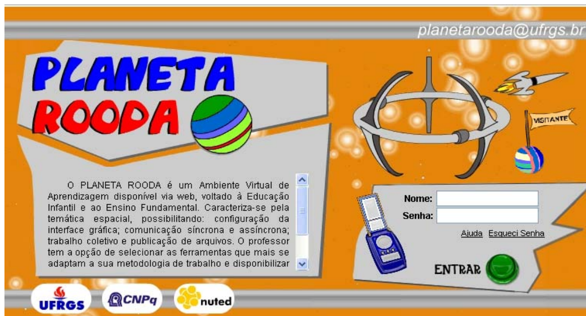
Tela de acesso ao PLANETA ROODA