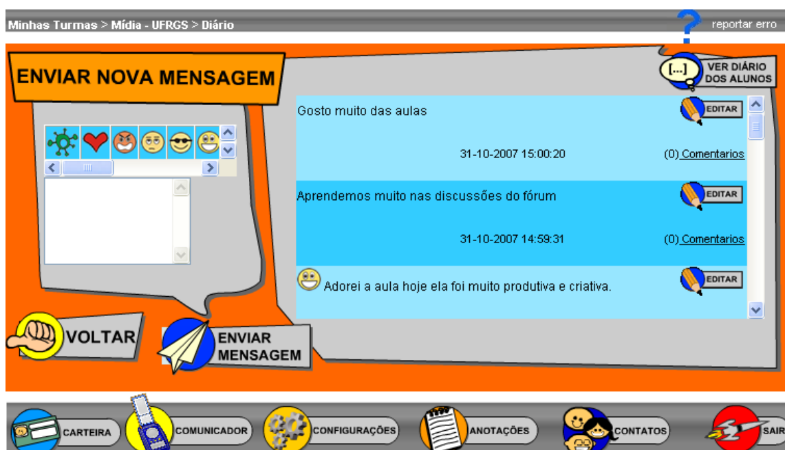
Tela Diário: visão do professor

Aluno - escreve sobre suas dúvidas, desafios, descobertas e êxitos em forma de mensagens que ficam listadas, informando data e hora de envio. Visualiza os comentários dos formadores nas suas mensagens. Caso o professor habilite em Dados da Turma , o aluno poderá visualizar e comentar o diário dos colegas no botão Ver Diário dos Colegas e também ter comentários desses nas suas mensagens.