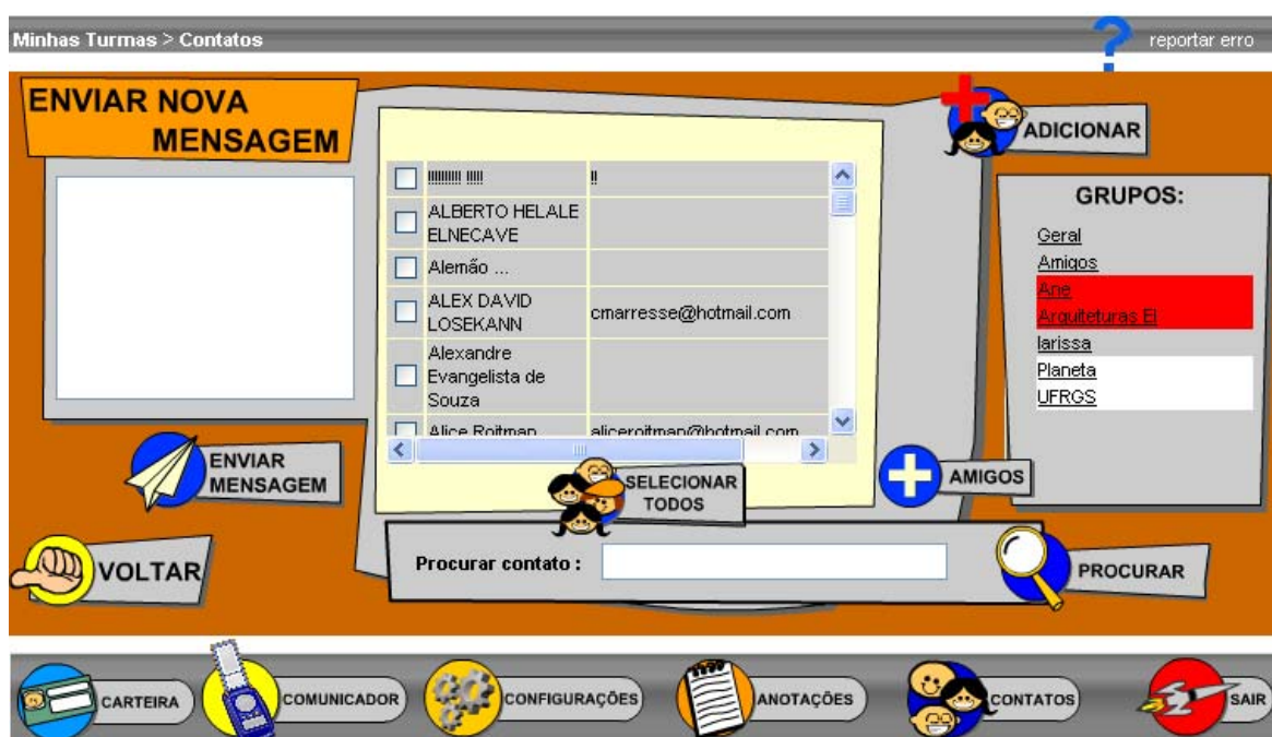
Tela dos contatos

O usuário tem a possibilidade de Procurar contato pelo nome para qual colega ou aluno irá enviar um e-mail ou selecionar todos para enviar a mesma mensagem para todo o grupo.