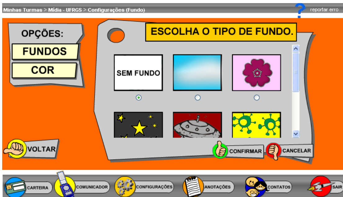
Tela das Configurações

Nas Configurações , você pode personalizar a interface gráfica do PLANETAROODA, trocando o tipo e a cor de fundo.