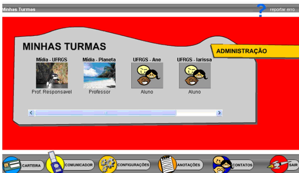
Tela "Minhas Turmas": acessada após entrar no PLANETA ROODA.

O professor pode cadastrar nas suas turmas professores auxiliares e monitores . Os primeiros possuem acesso aos mesmos recursos do professor responsável; já os monitores , fazendo parte dos formadores, têm acesso a todos os recursos das funcionalidades habilitadas para a turma, como um professor. Esses, porém, visualizam os Dados da Turma como alunos, ou seja, não podem realizar atividades de gerenciamento da turma. O monitor somente tem acesso à funcionalidade Documentação Pedagógica, se o professor habilitar isto em Dados da Turma. O professor adiciona monitores para auxiliá-lo no desenvolvimento e na manutenção das atividades da turma. Conforme o vínculo com a turma, o aluno é o usuário que pode apenas participar das atividades criadas p/ sua turma, sendo que o acesso aos diferentes recursos muda de acordo com a forma que o professor configura as funcionalidades em Dados da Turma.